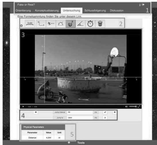
Abb. 1: Komponenten des Videoanalyse-Labs, eingebettet im ILS.

Die erfasste Flugbahn, sowie die daraus ableitbaren Parameter wie die horizontale und vertikale Geschwindigkeit bzw. Beschleunigung, können von den Lernenden analysiert werden. Um ihnen die Analyse zu erleichtern, ist eine visuelle Repräsentation der Daten sinnvoll. Aufgrund von Interoperabilität zwischen den Apps kann beispielsweise der Data Viewer , eine Go-Lab Inquiry App, kinematische Graphen darstellen (siehe Abb. 2). Beobachtungen während der Datensammlung und -analyse können mit dem Observation-Tool festgehalten werden. Erstellte Hypothesen, Beobachtungen und Graphen können dabei im Conclusion-Tool zu einer Schlussfolgerung aggregiert werden. Das Szenario endet damit, dass die Schüler ihr Vorgehen und ihre Ergebnisse zusammenfassen, kritisch reflektieren und die Ergebnisse in der Klasse diskutieren ( Discussion ).