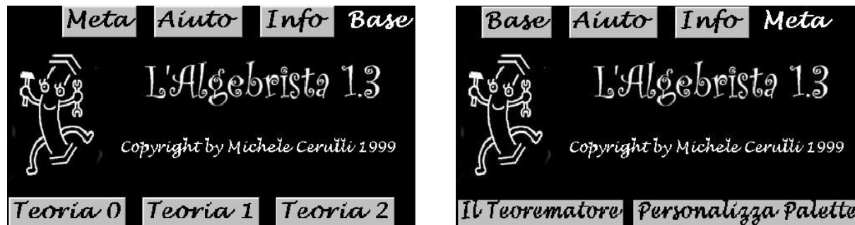
Fig1. - Il menù Base ed il menù Meta

programma Mathematica . All'avvio, esso presenta una scelta tra quattro differenti menù che si chiamano rispettivamente Base , Meta , Aiuto e Info . Come è facile aspettarsi, i menù Info e Aiuto forniscono rispettivamente informazioni su L'Algebrista e le modalità d'utilizzo dei micromondi (e degli ambienti) che esso offre, per tanto non li analizzeremo in questa sede ma procederemo presentando più dettagliatamente gli altri due menù.