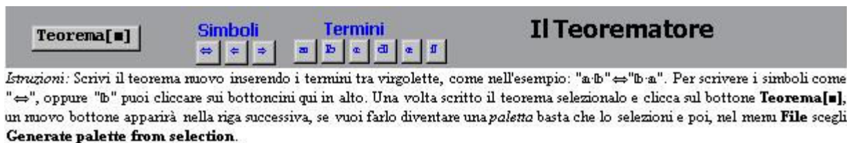
Fig.3 - Il Teorematore

Concludiamo con un paio di osservazioni sulla notazione usata: sia la proprietà associativa, che quella commutativa, sono state rappresentate utilizzando il simbolo « \square » invece dei simboli « + » e « \bullet », questo per economia di scrittura e per abituare gli studenti a generalizzare le proprietà di struttura; infine, per gli stessi motivi abbiamo rappresentato il bottone a rischio, utilizzando dei triangolini, quadratini, e cerchi, che stanno a rappresentare espressioni qualsiasi.