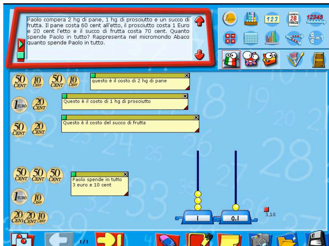
Figura 1: Interfaccia del foglio soluzione con un esempio di soluzione.

In questo ambiente l'utente può incollare rappresentazioni costruite nei micromondi (in questo caso in Euro e in Abaco), può inserire commenti per mezzo di "post-it", può aggiungere pagine, stampare la soluzione costruita, cancellare il lavoro fatto. Dal Foglio Soluzione si può accedere ai micromondi, selezionando le icone visualizzate in alto a destra. Il foglio soluzione, così come tutti gli altri strumenti di ARI@ITALES, è disponibile in tre lingue comunitarie: l'italiano, l'inglese e lo spagnolo.