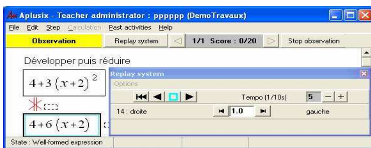
Figure 1. Vérification de nos hypothèses d'interprétation à l'aide du magnétoscope.

Donnons en un exemple : un élève transforme 4 + 3(x + 2)^2 en 10(x + 2) . En rejouant ce que cet élève a pu effacer comme calcul, il apparaît que 4 + 6(x + 2) est une étape "cachée" intermédiaire à son calcul, comme le montre l'impression de l'écran, Figure 1. Ainsi avons-nous interprété la transformation erronée comme une succession de deux règles : « ax^n \rightarrow nax » et « a + bc \rightarrow (a + b)c ».