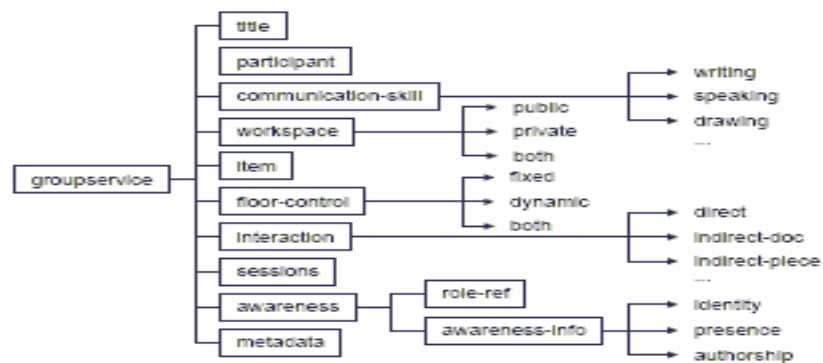
Figure 5. Extension de l'élément LD "service" [HERNANDEZ & al. 04]

dispositif. Là, nous avons proposé l'extension de LD par la primitive « groupservice » présentée dans [HERNANDEZ & al. 04] (cf. fig 5).